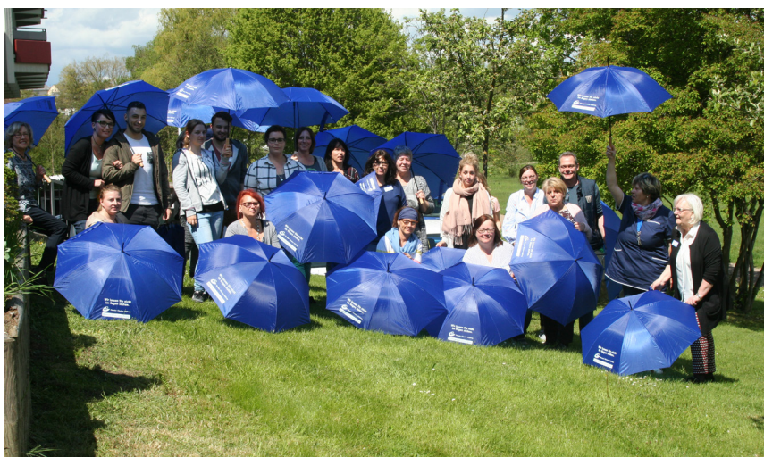
Die Schirme wurden noch nicht benötigt, kamen bei den Mitarbeitenden aber trotzdem an.